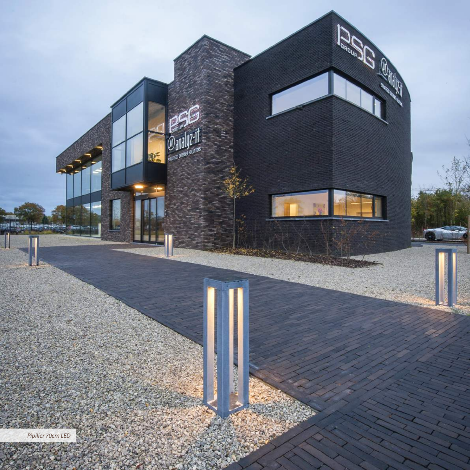
Pipilier 70cm LED